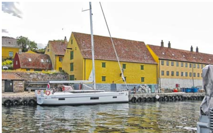
W porcie Christianso

mów, zmierzających do lub wypływających z Ronne. Ruch jest tutaj duży, bowiem Ronne to największy port pasażerski na Bornholmie.