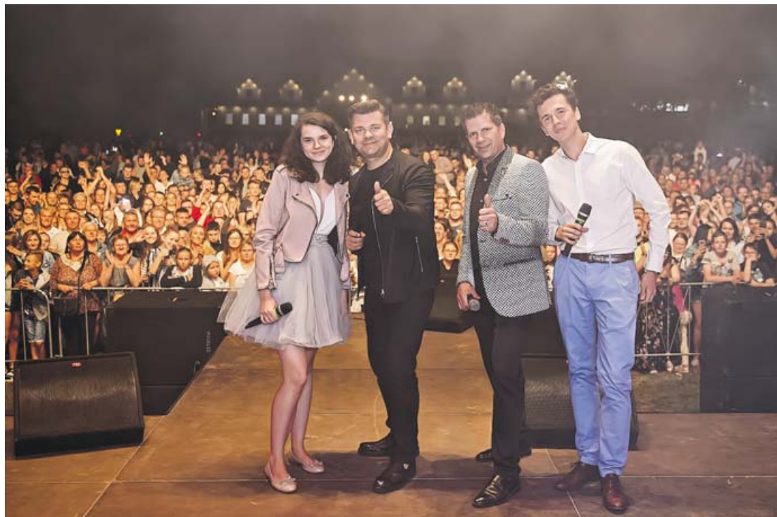
Publiczność licznie zgromadziła się przy estradzie