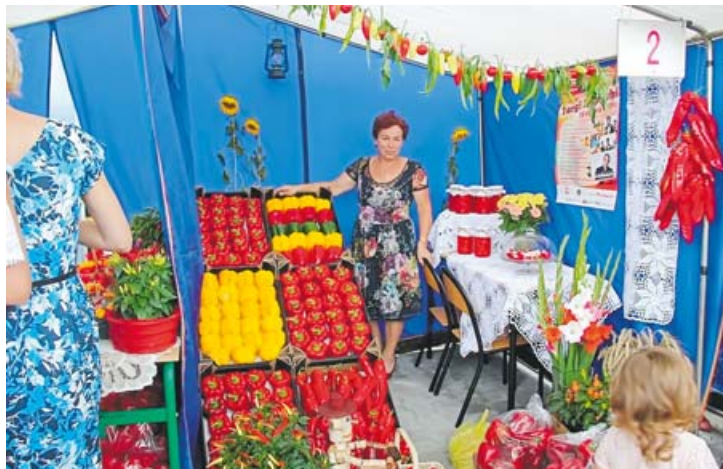
Na stoiskach królowała papryka

– To jest naprawdę udana impreza. Chyba 20 lat temu nikt się nie spodziewał, że urośnie ona do rangi ogólnopolskiego wydarzenia. Jest nas tu naprawdę dużo. Cieszę się, że z minuty na minutę