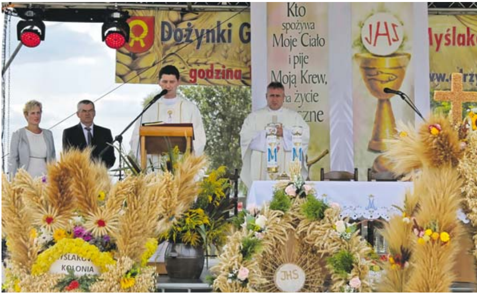
Msza polowa w Myślakowicach