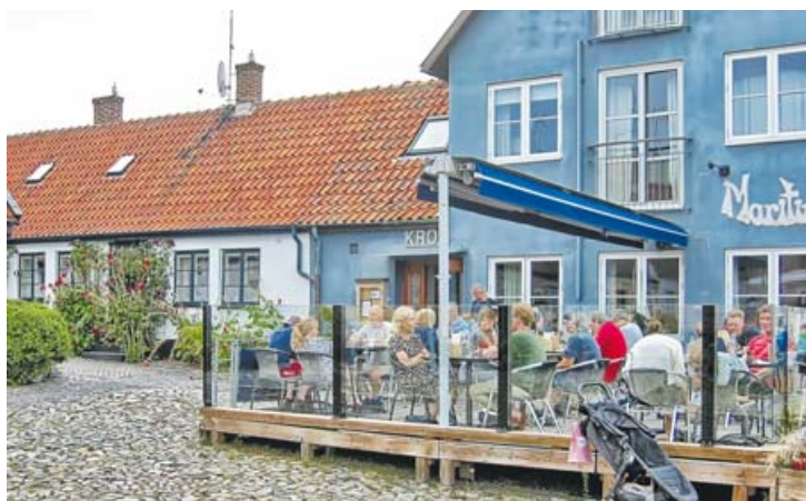
Urokliwy zakątek Simrishamn