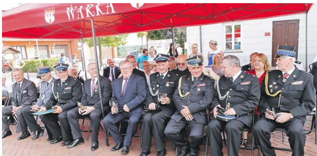
Gospodarze i goście w przerwie uroczystości