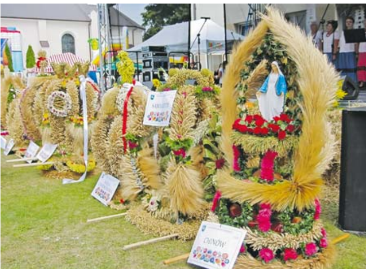
Prezentacja dożynkowych wieńców