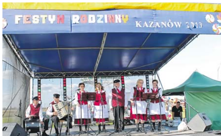
Śpiewa Zespół „Kazanowianki znad Iłżanki”