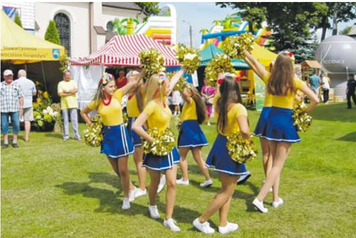
Cheerleaderki z Kozienic zebrały gorące brawa