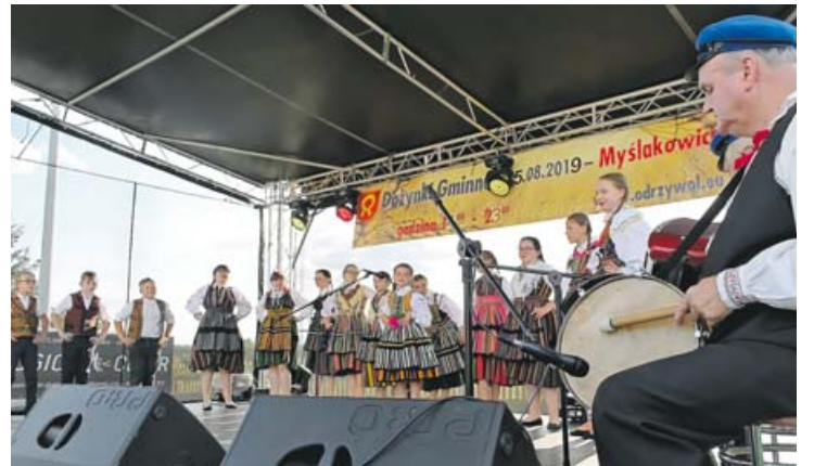
Śpiewają i tańczą „Przepióreczki”