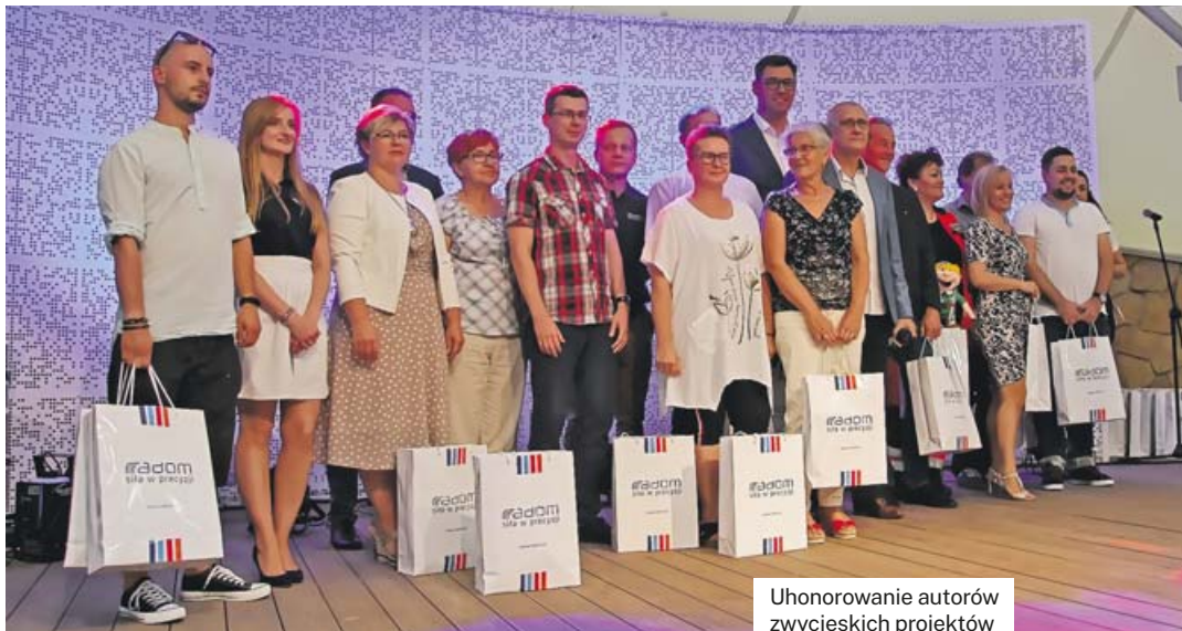
Uchonorowanie autorów zwycięskich projektów

Radom jako jedno z pierwszych miast wprowadził w 2013 roku budżet obywatelski, z realizacją złożonych projektów w roku następnym. Na początku była to kwota 3 mln zł. W tym roku osiągnęła już 5,8 mln. zł. Łącznie w ciągu tego okresu na finansowanie obywatelskich projektów przekazano już kwotę ponad 27 mln zł.