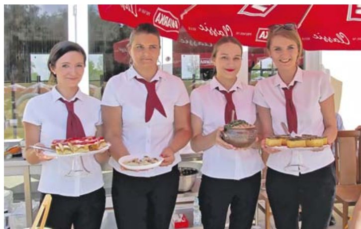
Panie z „Pałacu pod Dębami” zapraszają do poczęstunku