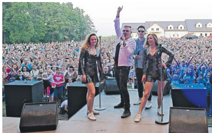
Piękna pogoda i szalona zabawa