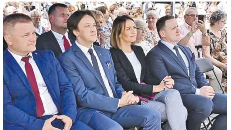
Uroczystości dożynkowe zgromadziły wielu gości