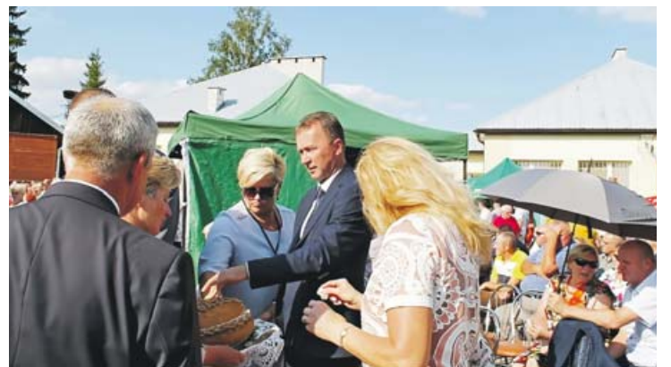
Dzielenie się chlebem