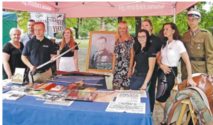
Ekspozycja projektu realizowanego z budżetu obywatelskiego na rok 2019 zgłoszonego przez ZSZ im Hubala w Radomiu pod tytułem „Radomianie poznają historię pierwszego partyzanta II wojny światowej”.

Wybrane przez radomian w tym roku projekty dotyczą przede wszystkim ochrony zdrowia, w tym zajęć profilaktycznych, opieki nad zwierzętami, ekologii i organizacji wydarzeń kulturalnych. JAL