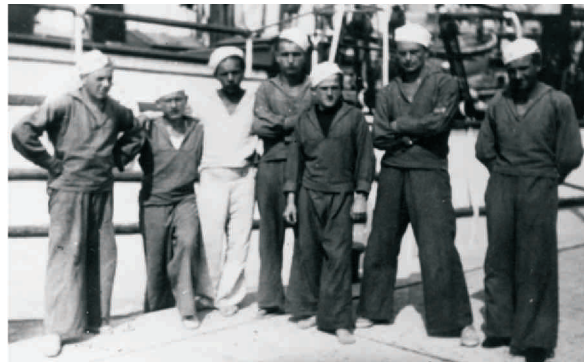
Żeglarze Chorągwi Radomskiej na „Zawiszy Czarnym” w 1937.