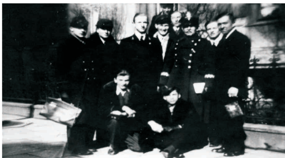
Delegacja XIII Drużyny Harcerzy im. Stefana Rogozińskiego w Radomiu, na Konferencji Drużyn Żeglarskich w Warszawie w 1935 roku. Spotkanie z gen. Mariuszem Zaruskim – kapitanem s/y „Zawisza Czarny”

Niezbędną formalnością stało się utworzenie krajowej organizacji reprezentującej żeglarstwo jako dyscyplinę sportu oraz zebranie odpowiednich funduszy. Nastąpiła pełna mobilizacja nielicznego jeszcze środowiska żeglarskiego.