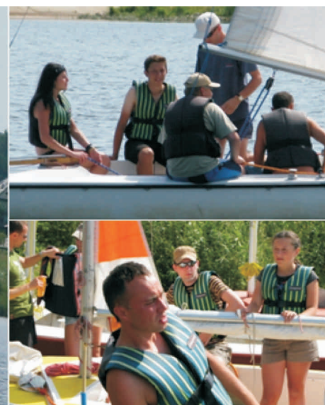
RADOMSKI OKRĘGOWY ZWIĄZEK ŻEGLARSKI. 33 LATA

Żeglować można praktycznie po 80% powierzchni jeziora. Zakaz pływania obejmuje jedynie pas bezpieczeństwa o szerokości około 100 metrów bezpośrednio przed zaporą oraz końcowy (południowy) fragment jeziora, na którym znajdują się naturalne ostoje ptactwa wodnego. Ten fragment jeziora jest bardzo płytki, o grząskim dnie, które dość często jest odłaniane przy niższych stanach wody. W obrębie zapory czołowej, łącznie z lewobrzeżną zatoką jest zakaz kotwiczenia ze względu na foliowe uszczelnienia dna, a także zakaz dobijania do brzegu prawego na odległość 200 m.