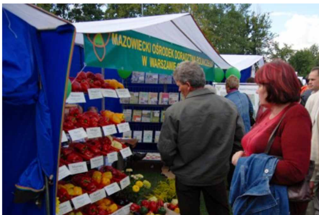
Ogólnopolskie Targi Papryki w Przytyku

wymiany informacji i doświadczeń dotyczących uprawy tego smacznego warzywa. Początkujący rolnicy, zainteresowani uprawą papryki na pewno otrzymają mnóstwo wskazówek od bardziej doświadczonych kolegów. Producenci mają ponadto możliwość zdobycia kontaktów z handlowcami, którzy skuszeni doskonałą jakością naszej papryki coraz liczniej odwiedzają Przytyk w pierwszą niedzielę września.