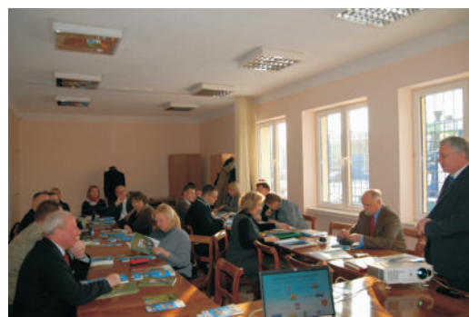
Konferencja nt. „Kształtowanie produktów turystycznych na obszarze LGD”

to jedno z najważniejszych wydarzeń kulturalnych podejmowanych i realizowanych w Jedlińsku we współpracy z Muzeum Witolda Gombrowicza we Wsoli . Przytyk – pępek Europy i paprykowe zagłębie , skąd pochodzi 80% krajowej produkcji papryki. Z kolei Zakrzew zamierza promować swoją najnowszą inicjatywę – Rycerzy Bogurodzicy – związaną z przypadającą w 2010 roku 600. rocznicą zwycięstwa wojsk polsko-litewskich.