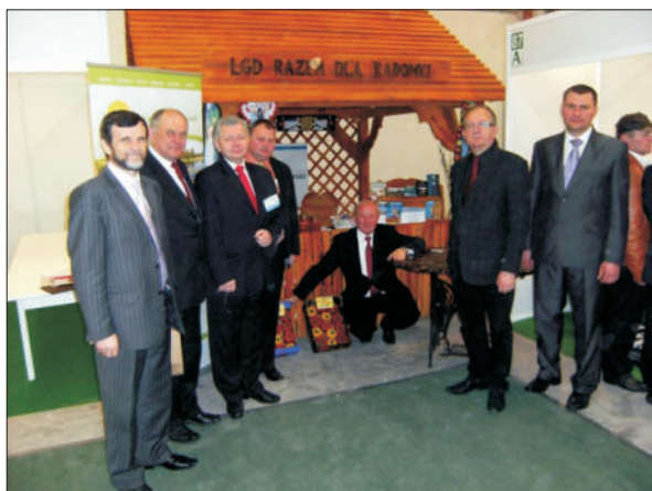
Targi Turystyki Wiejskiej i Agroturystyki AGROTRAVEL 2010

Lokalna Grupa Działania "Razem dla Radomki" w dniach od 9 do 11 kwietnia 2010 r. uczestniczyła w II Międzynarodowych Targach Turystyki Wiejskiej i Agroturystyki AGROTRAVEL 2010 , które odbyły się w Kielcach. Według danych organizatorów targi odwiedziło ponad 20 tysięcy osób, a wzięło w nich udział około 100 wystawców z Polski i z zagranicy.