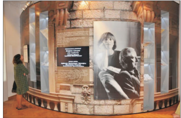
Muzeum Witolda Gombrowicza we Wsoli

Muzeum czynne jest od środy do niedzieli w godzinach 10.00-17.00.