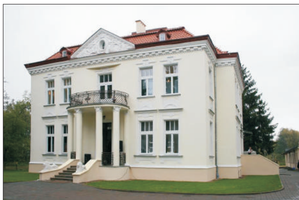
Muzeum Witolda Gombrowicza we Wsoli

10 października 2009 roku zainaugurowało swoją działalność Muzeum Witolda Gombrowicza we Wsoli, miejscowości znajdującej się w Gminie Jedlińsk. Jest to pierwsze muzeum w Europie poświęcone twórczości wybitnego polskiego pisarza. Na otwarcie muzeum przybyli liczni goście m.in.