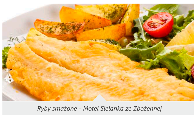
Ryby smażone - Motel Sielanka ze Zbożennej

szczupaka. Motel Sielanka został nagrodzony Laurem LGD „Razem dla Radomki” w konkursie na produkty lokalne w kategorii Produkty Mięsne i Rybne za produkt Karp w Śmietanie.