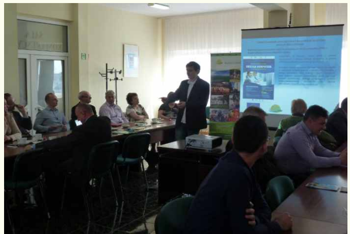
Konferencja inauguracyjna projekt Południowe Mazowsze - Marką Turystyczną fot: Stowarzyszenie LGD „Razem dla Radomki”