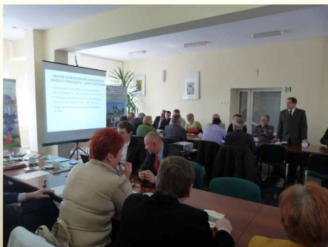
Konferencja inauguracyjna projektu Południowe Mazowsze - Marką Turystyczną

W czwartek 24 kwietnia w Jedlińsku odbyła się konferencja inauguracyjna projektu współpracy pn. „Południowe Mazowsze – Marką Turystyczną” realizowanego przez nasze Stowarzyszenie w partnerstwie z Lokalną Grupą Działania „Dziedzictwo i Rozwój” ze Zwolenia. Projekt ten zakłada realizację działań promujących obszar partnerów i turystykę na terenie gmin tworzących partnerskie LGD z terenu Południowego Mazowsza.