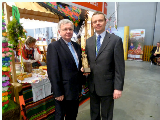
Targi Agrotavel 2014