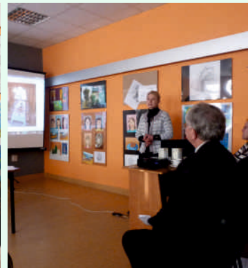
Konferencja: Promocja szlaków kulinarnych i produktów tradycyjnych