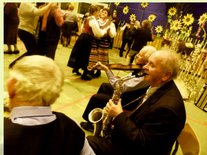
Andrzejkowe Folkowe we Wrzosie