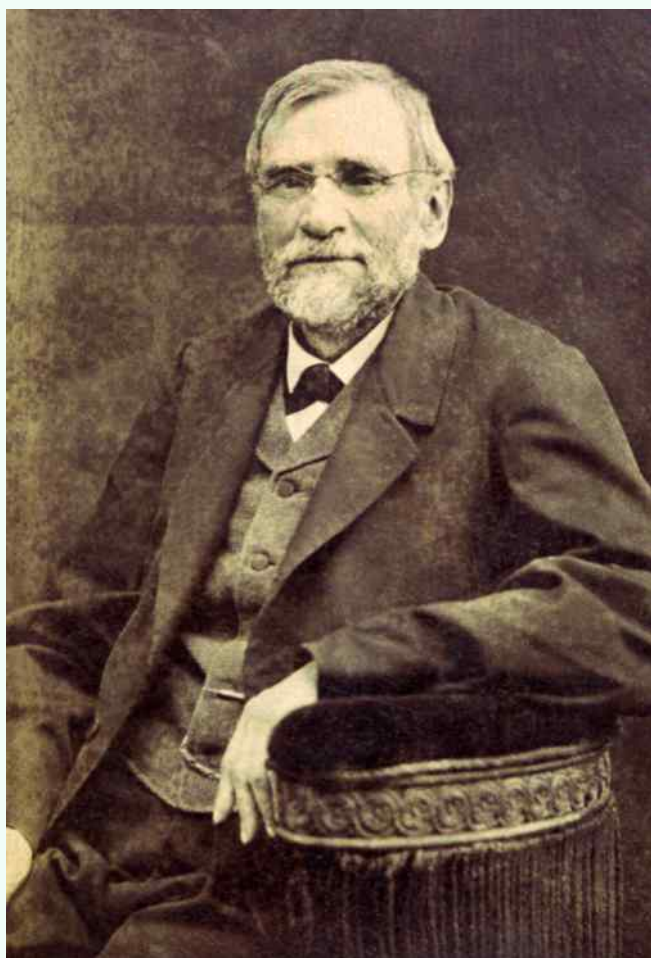
Oskar Kolberg

Sejm Rzeczypospolitej Polskiej 6 grudnia 2013r. przyjął uchwałę uznającą rok 2014 Rokiem Oskara Kolberga. Dokument ten przypomina, że zbliża się 200. rocznica jego urodzin. Podkreślono w nim szczególne znaczenie dorobku i dokonań tego kompozytora, folklorysty i etnografa, które na stałe wpisały się w kulturę polską i europejską. Zwrócono uwagę na wielkość dorobku tego twórcy, na który składają się m.in. 33 tomy monografii regionalnych i tematycznych oraz ok. 200 artykułów z zakresu etnografii, folklorystyki, językoznawstwa i muzykologii.