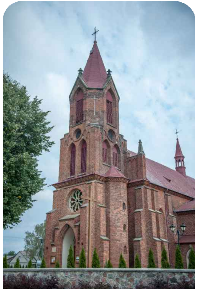
Kościół we Wrzosie

W XVII wieku w Przytyku zaczęli osiedlać się Żydzi, którzy w okresie międzywojennym stanowili większość mieszkańców (do 80 %).