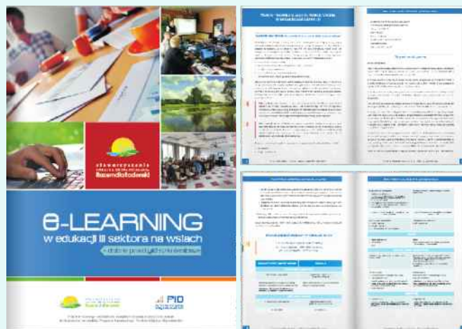
Poradnik on-line dla organizacji pozarządowych

Dzięki publikacji poznają Państwo najważniejsze informacje dotyczące funkcjonowania organizacji pozarządowych, w szczególności w zakresie: prawno-technicznych aspektów funkcjonowania org.; PR i promocja NGO – kampania społeczna; sponsoring i fundraising; finanse w NGO; zasady i przepisy