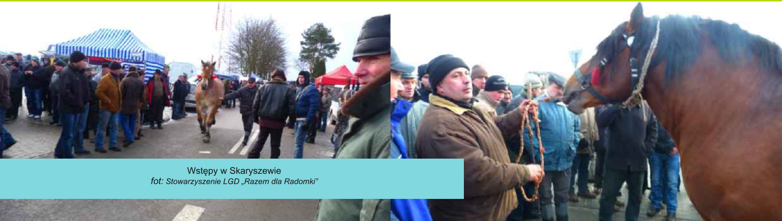
Wstępy w Skaryszewie