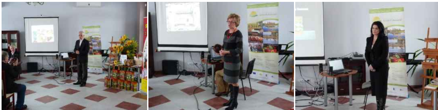
Seminarium "Produkt tradycyjny i lokalny elementem rozwoju obszarów wiejskich LGD Razem dla Radomki"