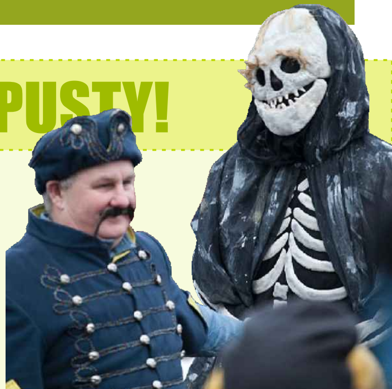
Jedlińskie Zapusty 2013r.

Widowisko „Ścięcia Śmierci” co roku przyciąga tłumy osób śledzących przebieg egzekucji kostuchy. Tegoroczna impreza trwała wzorem poprzednich lat 3 dni i była niezwykle interesująca. W kuse niedzielę odbył się Bal Karnawałowy, impreza która rozpoczęła huczne świętowanie trzech ostatnich dni karnawału.