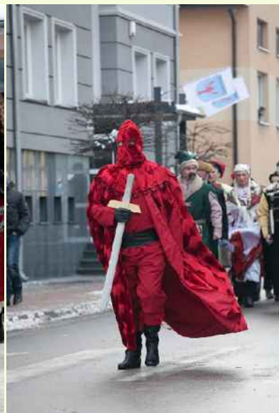
Jedlińskie Zapusty 2013r.