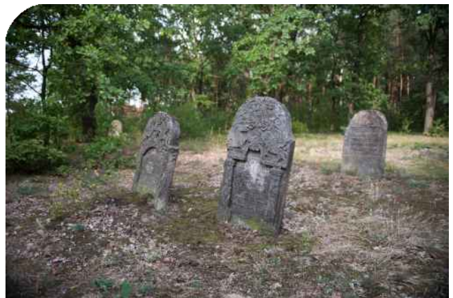
Kirkut w Przytyku

Wiek XVIII, to okres skomplikowanej sytuacji w Rzeczpospolitej, liczne nieporozumienia między reformatorami i ich przeciwnikami, czas, w którym uchwalono konstytucję 3 Maja obaloną następnie przez interwencję rosyjską i Konfederację Targowicką. W tym burzliwym okresie, przez Przytyk przemierzały a także stacjonowały, liczne oddziały wojskowe. 19 lipca 1704 roku z Błonia koło Warszawy przez Przytyk do Sandomierza przemierzał król Szwedów Karol XII, aby „znieść” Konfederację Sandomierską popierającą króla Augusta II.