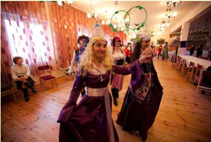
Zapustowy bal kobiet.