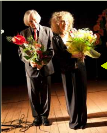
Jedlińskie Zapusty 2013r.