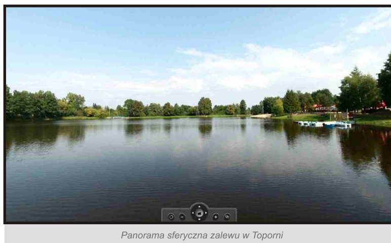
Panorama sferyczna zalewu w Toporni

Wirtualne wycieczki, czyli panoramy sferyczne przedstawiać będą ponad 40 miejsc z terenu gmin: Jedlińsk, Przytyk, Przysucha, Wieniawa, Wolanów, Zakrzew. Są to interaktywne fotografie panoramiczne obejmujące obszar większy niż 180 stopni w poziomie, umożliwiające