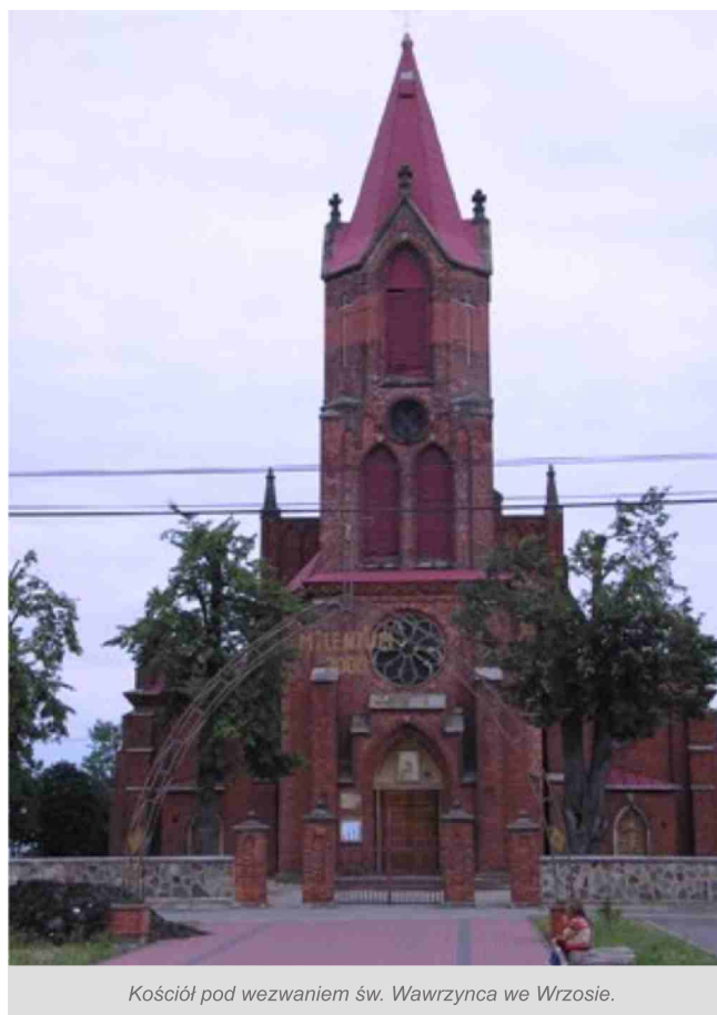
Kościół pod wezwaniem św. Wawrzyńca we Wrzosie.

Podczas prowadzenia prac renowacyjnych tak w kościele jak i w otoczeniu świątyni natrafiono na kilka ciekawych