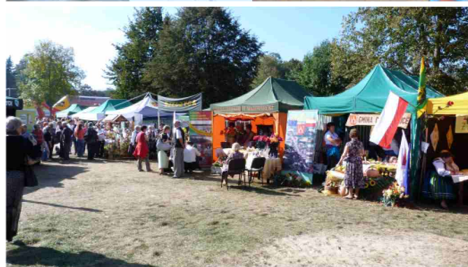
1. Dożynki Mazowieckie w Wyszkowie; 2. Stoiska wystawiennicze w Wyszkowie; 3. Punkt informacyjny LGD Razem dla Radomki w Wyszkowie; 4. Stoisko UM i LGD