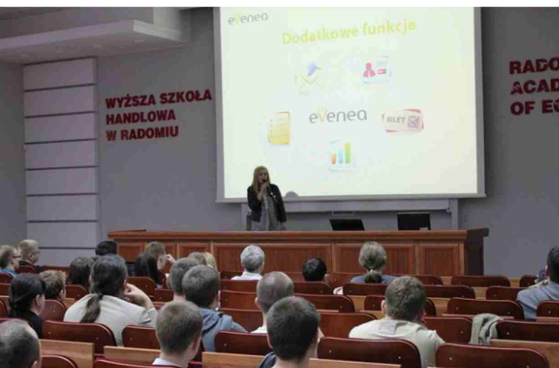
RadomIT