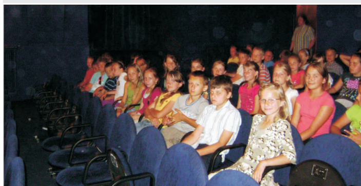
Wyjazd do teatru do Lublina