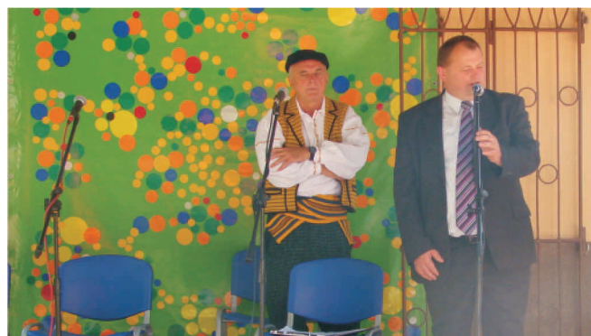
Otwarcie Imprezy przez Wójta Gminy

Uczestnikami spotkania byli instrumentalści oraz kapele z terenu powiatów przysuskiego, szydłowieckiego, radomskiego i opoczyńskiego. Zaprezentowali liczne tańce ludowe: Mazuki, Oberki, Polki, Walczyki twórczości patrona. W trakcie imprezy odbył się przegląd, podczas którego wybierani byli zwycięzcy w 2 kategoriach: kapel ludowych z udziałem instrumentalistów, harmonia polska pedałowata i rozciągana, akordeon i skrzypce, bęben i bębenek oraz w kategorii instrumentalistów – solistów, harmonia, akordeon i skrzypce. W przeglądzie zwyciężyli: