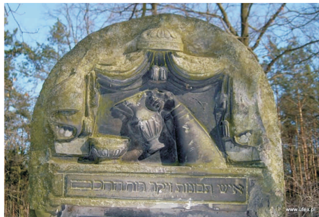
Przytyk - zdobienie jednej z macew na cmentarzu żydowskim

Śladem działalności Żydów w Przytyku widocznym do dziś jest kirkut (cmentarz żydowski) oraz znajdujące się na nim bogato zdobione macewy (nagrobki). Cmentarz ten