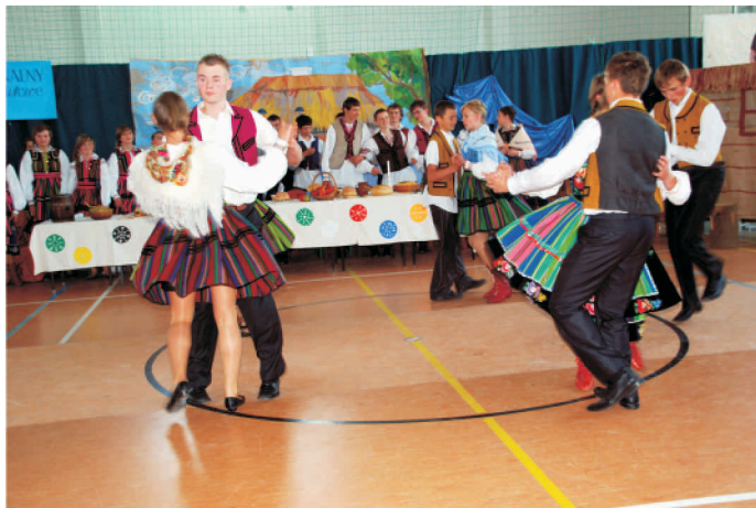
Realizacja projektu "Dziedzictwo Kulturowe Przytyka"

Podsumowaniem imprezy był występ młodzieży z Publicznego Gimnazjum w Przytyku, która zaprezentowała widowisko pt. „Mój region – moja historia”, podczas którego dzieci w zakupionych strojach ludowych zaprezentowały tańce ludowe, sceny rodzajowe. W ramach projektu wydany został również w nakładzie 150 sztuk – folder prezentujący historię Turniejów Regionalnych oraz zawierający scenariusze poszczególnych uroczystości.