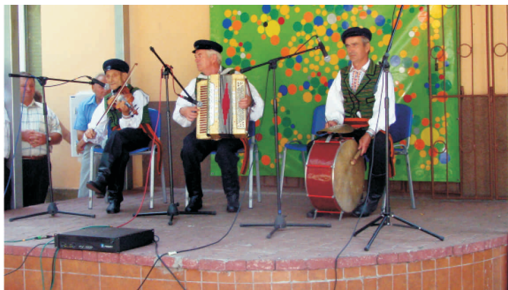
Kapela Rodzinna Pańczaków i Gacy