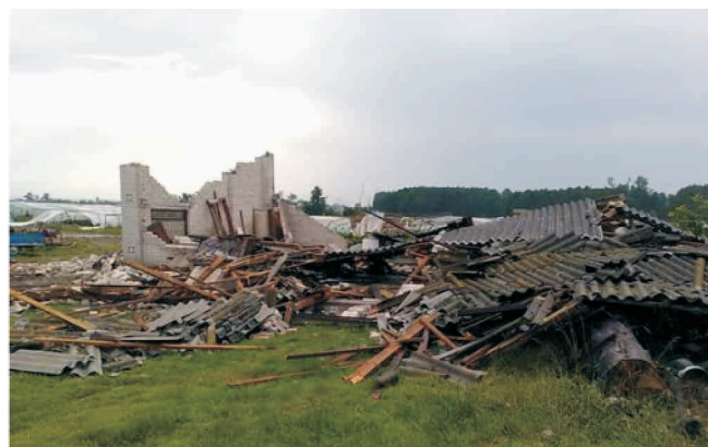
Budynek we Wrzeszczowie