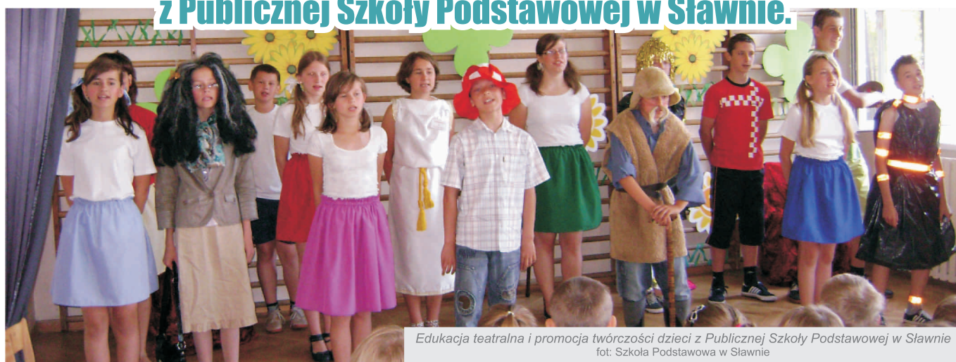
Edukacja teatralna i promocja twórczości dzieci z Publicznej Szkoły Podstawowej w Sławnie