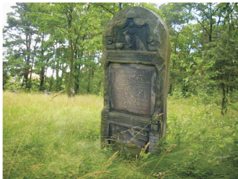
Macewa na cmentarzu żydowskim

W wyniku I wojny światowej Przytyk stracił wielu mieszkańców, na szczęście zniszczeniu nie uległo zbyt wiele posiadłości. Kolejne lata i okres międzywojenny to w historii Przytyka problem zróżnicowania narodowego i wyznaniowego mieszkańców. Podczas II wojny światowej Przytyk i najbliższe okolice zmieniły się w niemiecki poligon. Ludność pochodzenia polskiego została wysiedlona zaś