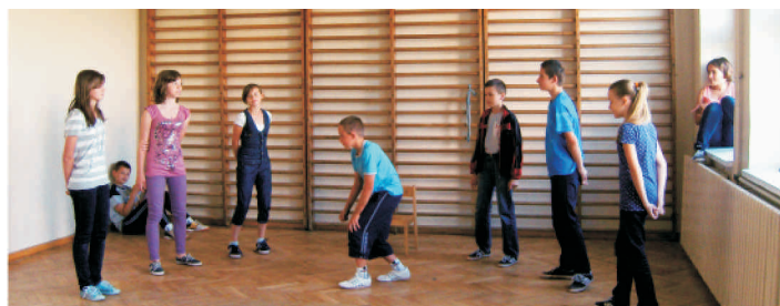
Zajęcia koła teatralnego i muzyczne w szkole