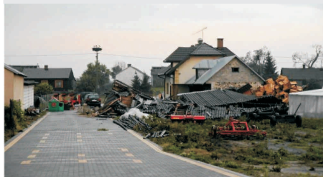
Powiat radomski