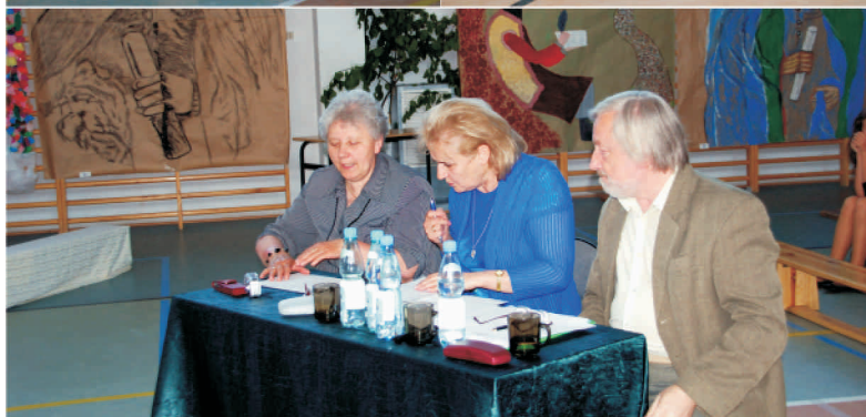
Realizacja projektu „Dziedzictwo Kulturowe Przytyka”

w projekcie, i który zadbał o prawidłowe przygotowanie i przeprowadzenie imprezy. Turniej miał formę konkursu, do którego przystąpiły zaproszone szkoły. Każda z nich przygotowała inscenizację prezentującą zwyczaje i obrzędy kulturowane w regionie przytyckim.