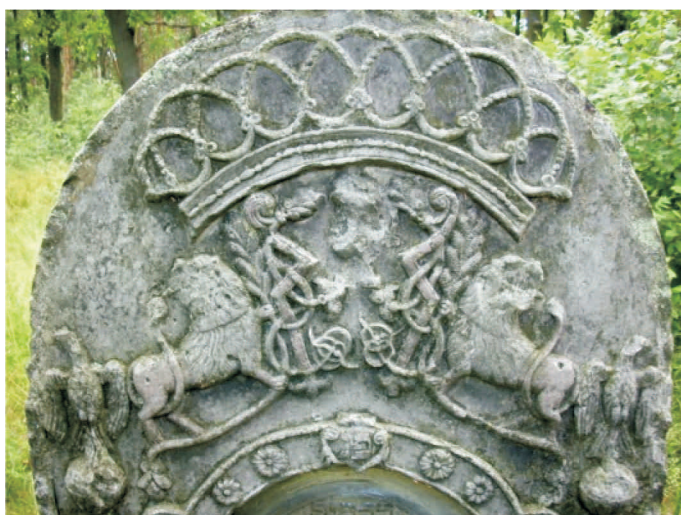
Przytyk - bogate zdobienie jednej z macew na cmentarzu żydowskim

Żydów wywieziono do gett w Szydłowcu oraz Przysusze.