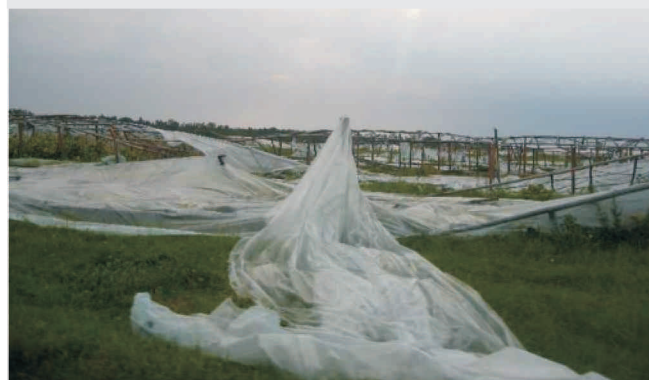
Połamane tunele