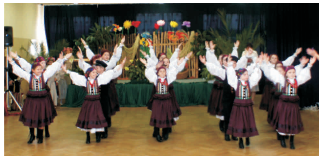
Zespół Zakrzewiaki