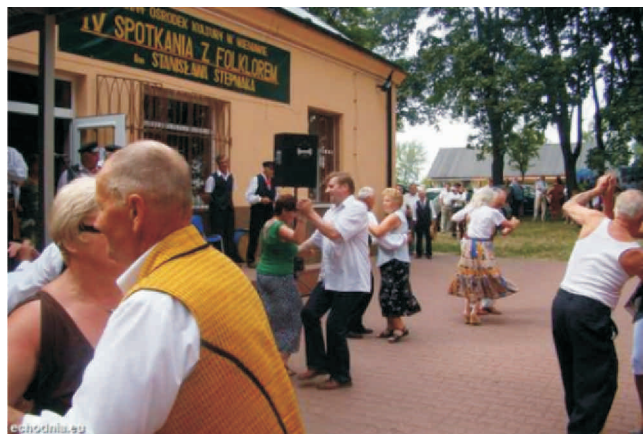
Spotkanie z folklorem im. Stanisława Stępniaaka

W spotkaniach z folklorem będą uczestniczyć kapele i instrumentalści z powiatu przysuskiego, szydłowieckiego, radomskiego i opoczyńskiego. W trakcie imprezy odbędzie się przegląd, podczas którego wybierani będą zwycięzcy w 2 kategoriach: kapel ludowych z udziałem instrumentalistów, harmonia polska pedałowa i rozciągana, akordeon i skrzypce, bęben i bębenek oraz w kategorii instrumentalistów – solistów, harmonia, akordeon i skrzypce. Rywalizować będą m.in. następujące kapele: Braci Tarnowskich, Wacława Imiołka, Tadeusza