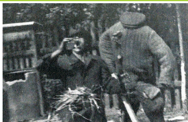
Teatr Tarnowskich, ok. 1953 r. Spektakl drugiego dnia wesela pt. "Dziad Amerykański". fot. pub. "Sprzedana muzyka" aut. Andrzej Bieńkowski

mazurek, oberek, rumbę, fokstrota, polkę, czy tango. W 1990 roku kapela zakończyła granie po weselach. Pojawiły się instrumenty elektroniczne i wyparty muzykę ludową, która stawała się coraz bardziej zapomniana.