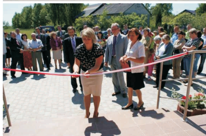
Wiejski Ośrodek Kultury w Woli Więcierzowej