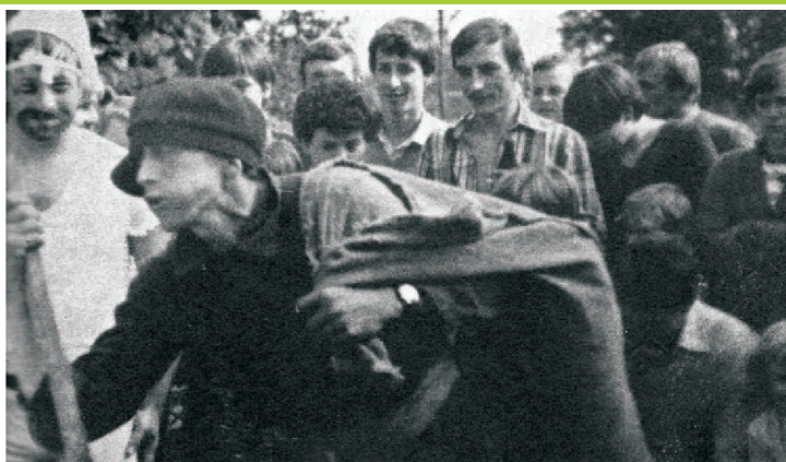
Teatr Tarnowskich, 1975 r. Na weselu w Podkannej, Radomskie fot. pub. "Sprzedana muzyka" aut. Andrzej Bieńkowski