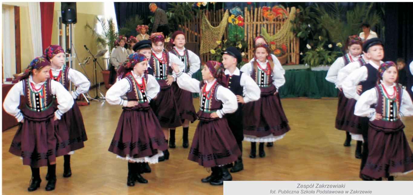
Zespół Zakrzewiaki