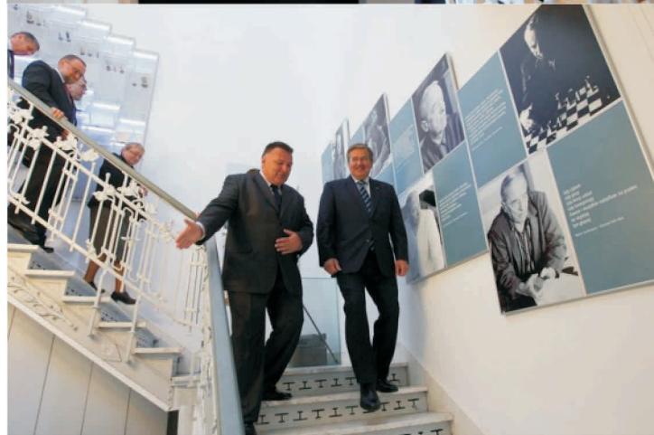
Wizyta Prezydenta Bronisława Komorowskiego w Muzeum Gombrowicza we Wsoli