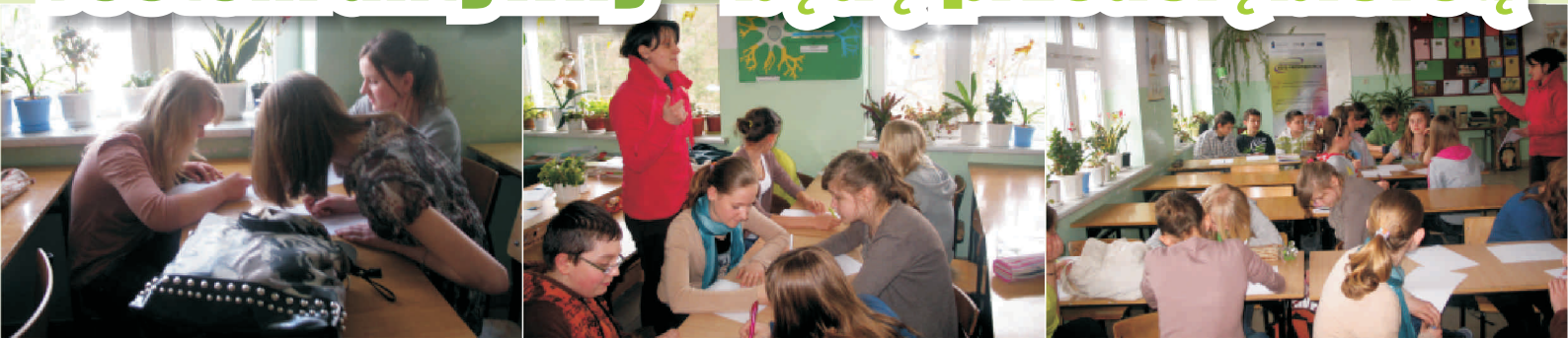
Innowacyjny Klub Przedsiębiorczości z Wieniawy

Przed nami okres wakacyjny, a w szkolnych klubach przedsiębiorczości jego uczestnicy nadal stawiają na aktywność i pomysłowość. Prezentujemy galerię zdjęć z Innowacyjnych Klubów Przedsiębiorczości z Wieniawy, Wolanowa i Jedlińska , w których uczniowie szkół gimnazjalnych, uczestniczą w zajęciach których celem jest propagowanie postaw innowacyjnych i przedsiębiorczych wśród młodych ludzi, rozwijanie twórczego myślenia, zdolności podejmowania ryzyka i realizowania nowatorskich pomysłów.