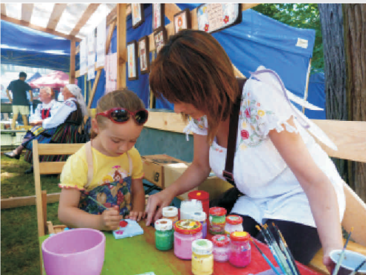
Warsztaty z rękodzieła ludowego - malarstwo