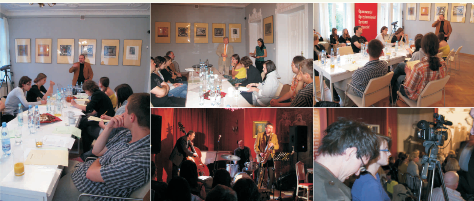
Projekt: Nieakademicka Szkoła Twórczego Pisania