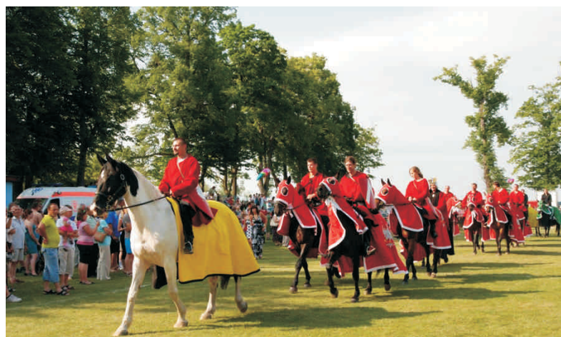
Rycerze Bogurodzicy w Taczowie 2010 r.

Podczas tegorocznej imprezy czeka na nas nie mniej atrakcji. Już od godziny 11.00 rozpocznie się Festyn Rycerski, podczas którego obejrzeć będziemy mogli pokazy musztry paradnej i bojowej wojsk królewskich, kawaleryjskie gonitwy rycerskiej, turniej łuczniczy i kusznicy. O godzinie 17.00 rozpocznie się koncert muzyki biesiadnej „Babska Biesiada” a od godziny 19.00 będziemy mogli podziwiać inscenizację Bitewną