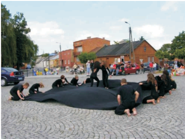
Apetyt na Gombrowicza

Spektakl plenerowy, koncerty, recitale znajdują się w programie czwartej już edycji imprezy plenerowej „Apetyt na Gombrowicza” która odbędzie się w dniach 17 i 18 czerwca 2011 r.