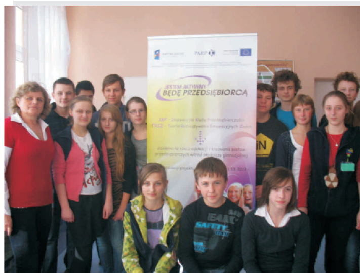
Innowacyjny Klub Przedsiębiorczości z Jedlińska