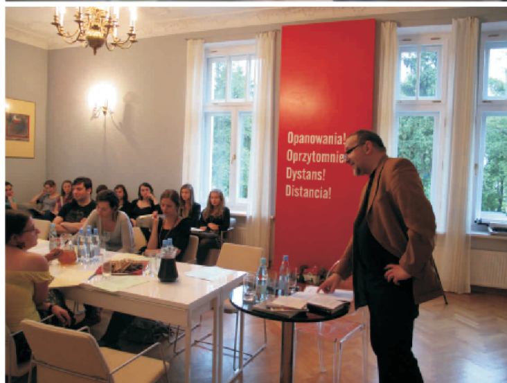
Nieakademicka Szkoła Twórczego Pisania - Warsztaty Literackie we Wsoli fot. Stowarzyszenie LGD Razem dla Radomki