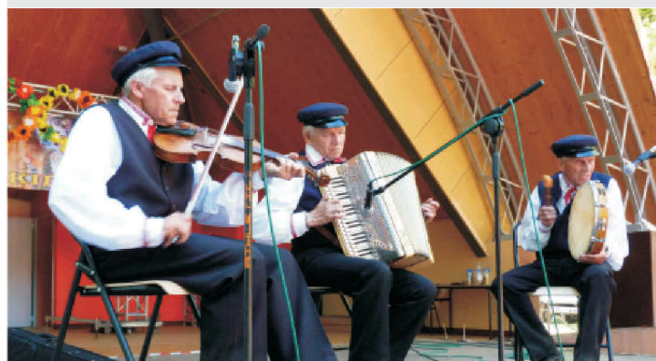
Koncert Kapeli Braci Tarnowskich z Domaniowa