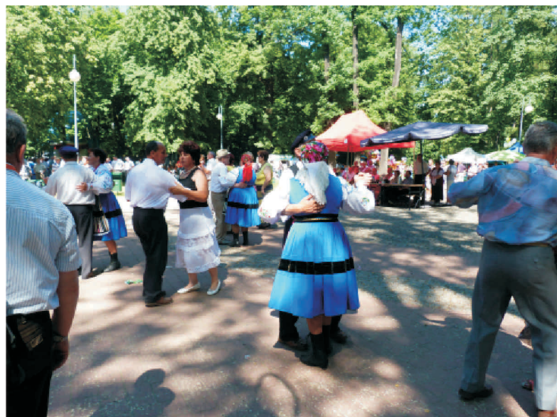
Zabawa ludowa

W niedzielę 5 czerwca w Amfiteatrze w Przysusze odbyły się 52 Dni Kolbergowskie, będące jedną z najważniejszych na mapie naszego województwa