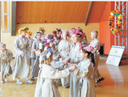
Występ dziecięcego zespołu ludowego Zakrzewiaki z PSP w Zakrzewie