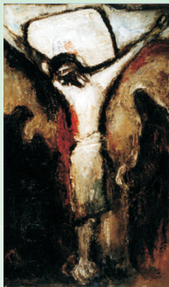
Władysław Paciak "Pod Krucyfiksem", 1962

Mimo, że jego artystyczna pasja często budziła zdziwienie u otaczających go ludzi, nie zaniedbywał pracy nad doskonaleniem rysunku. Tuszem, kredką, akwarelą odtwarzał pejzaże, codzienne zajęcia ludzi na