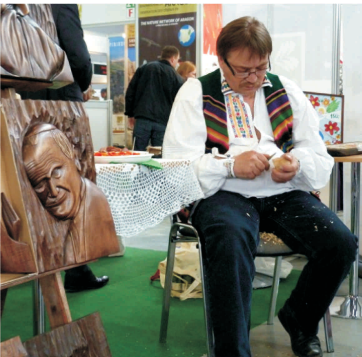
Stoisko LGD Razem dla Radomki na targach Agrotavel 2011