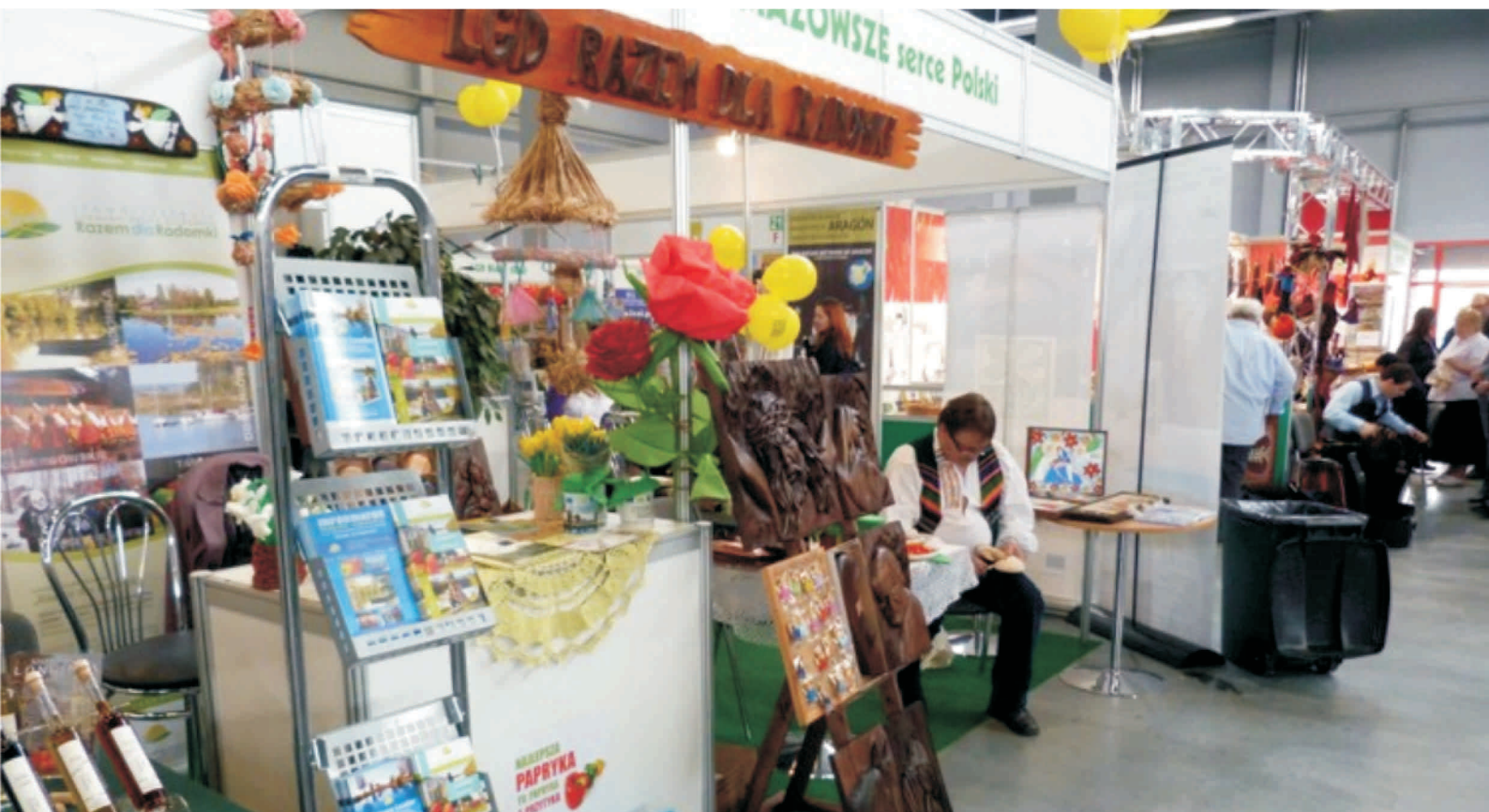
Stoisko LGD Razem dla Radomki na targach Agrotavel 2011

Targi stanowią doskonale miejsce do promocji i prezentacji oferty turystycznej obszarów gmin tworzących Stowarzyszenie, do zaprezentowania