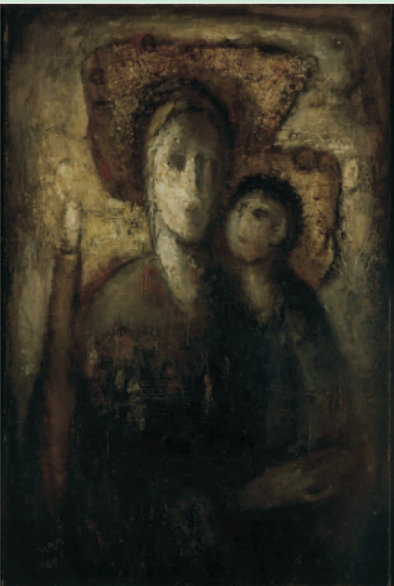
Władysław Paciak, Matka Boska Gromniczna , 1962 r.

Kolekcja Muzeum Sztuki Współczesnej w Radomiu