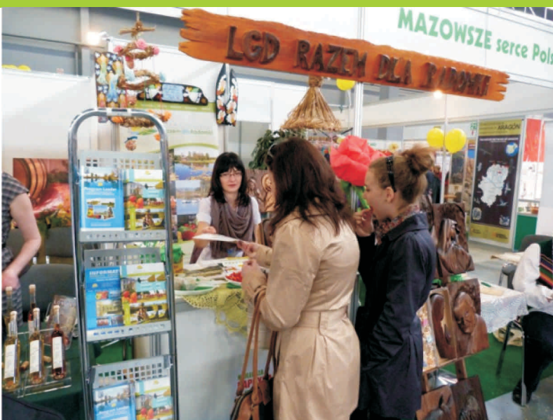
Stoisko LGD Razem dla Radomki na targach Agrotavel 2011