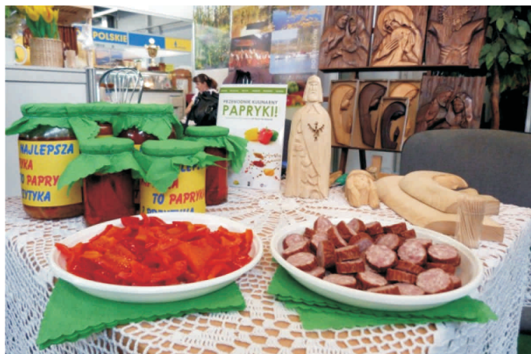
Stoisko LGD Razem dla Radomki na targach Agrotavel 2011

Podczas tegorocznej edycji targów na specjalnie przygotowanych stoiskach zaprezentowało się 141 wystawców, w tych 16 polskich regionów , Lokalne Grupy Działania, organizacje turystyczne, gospodarstwa agroturystyczne, prywatni przedsiębiorcy działający w zakresie rozwoju turystyki wiejskiej i agroturystyki oraz wystawcy z Francji, Ukrainy, Węgier, Hiszpanii, Bułgarii, Litwy, Gruzji i Ukrainy.