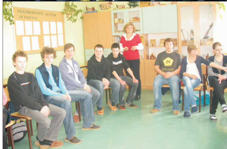
Rozpoczęcie funkcjonowania Innowacyjnego Klubu Przedsiębiorczości w Publicznym Gimnazjum im. Biskupa Piotra Gołębiowskiego w Jedlińsku.