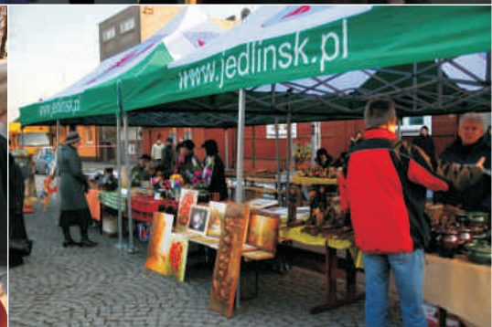
Ścięcie Śmierci w Jedlińsku 2011r.