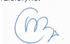
Prezes Zarządu Stowarzyszenia LGD „Razem dla Radomki”

Życzymy przyjemnej lektury i zachęcamy do dzielenia się uwagami, spostrzeżeniami oraz informacjami na łamach Biuletynu.