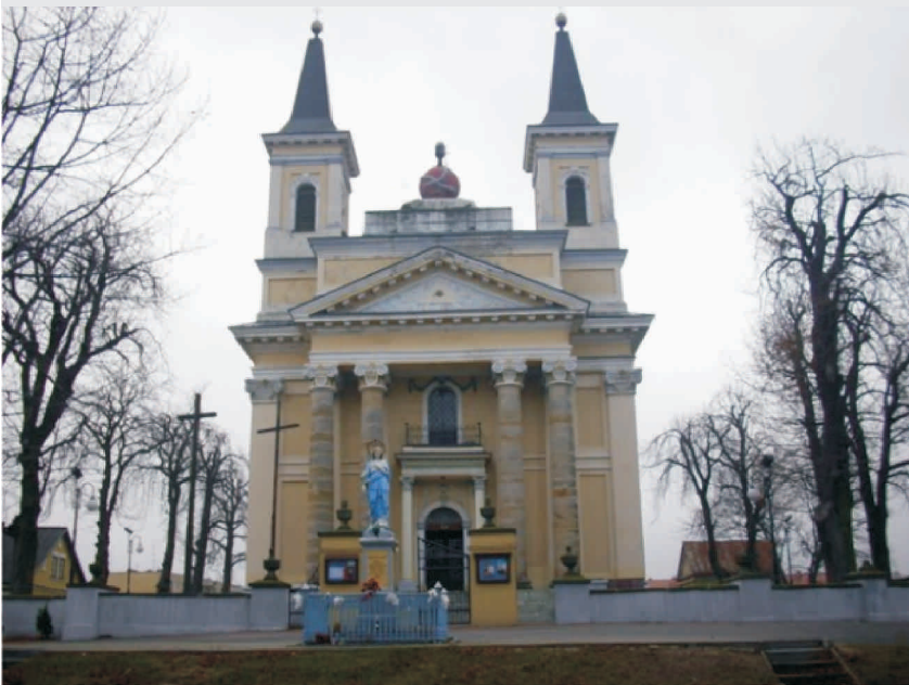
Kościół p.w. św. Jana Nepomucena w Przysusze