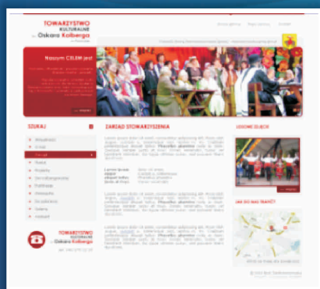
Towarzystwo Kulturalne im. Oskara Kolberga w Przysusze www.ttkolberg.pl