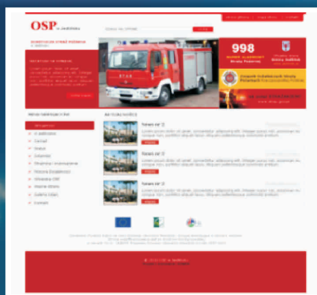
Ochotnicza Straż Pożarna w Jedlińsku www.ospjedlinsk.pl