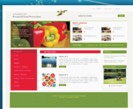
Towarzystwo Przyjaciół Ziemi Przytyckiej www.ziemiaprzytycka.pl