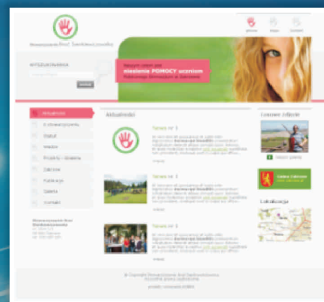
Stowarzyszenie "Bracia Sienkiewiczowska" www.bracsienkiewiczowska.pl