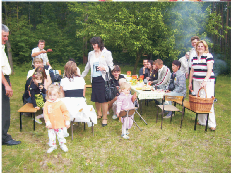
Stowarzyszenie Wrzosowisko