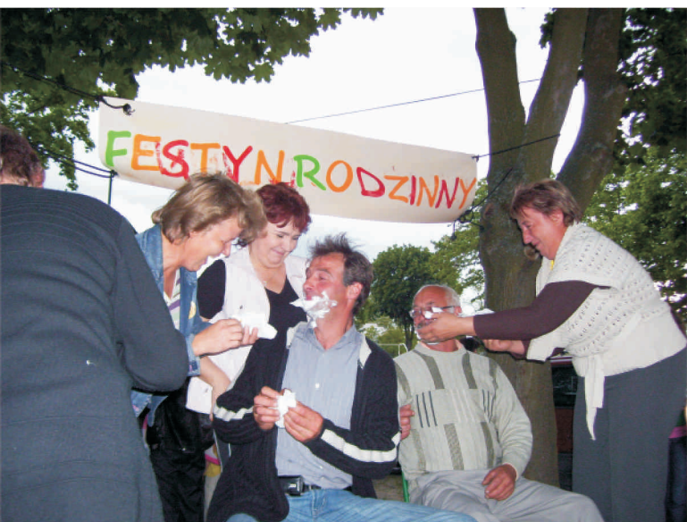
Stowarzyszenie Wrzosowisko

Agnieszka Czubak Stowarzyszenie Wrzosowisko