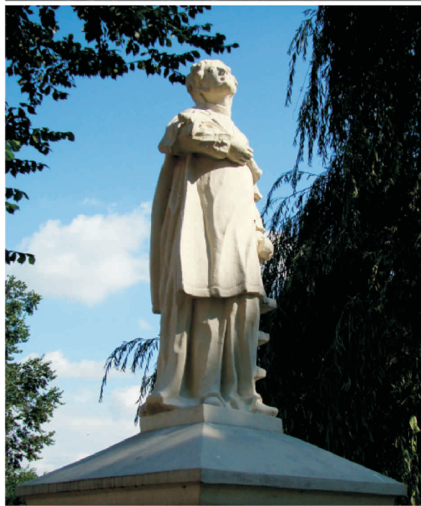
Figura Św. Wawrzyńca

10-ej wieczór płomienie ognia, porzrucane tu i ówdzie, niszczyły do reszty zwęglone belki, a sterzące rzędy wysmukłych kominów świadczą o groźnym pożarze".