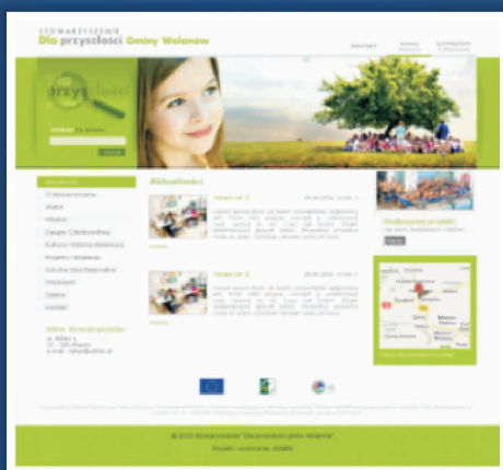
Stowarzyszenie "Dla Przyszłości Gminy Wolanów" www.stowarzyszenie-wolanow.pl