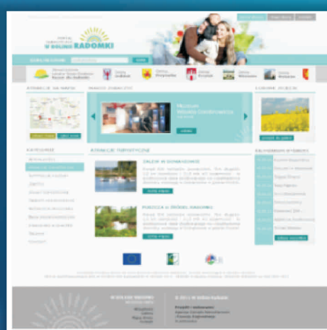
Portal turystyczny "W dolinie Radomki" www.wdolinieradomki.pl