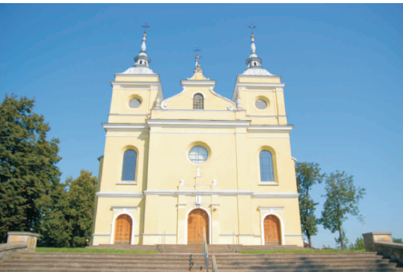
Kościół Św. Krzyża w Przytyku

Na terenie gmin wchodzących w skład LGD „Razem dla Radomki” znajduje się wiele niezwykle ciekawych obiektów sakralnych. Jedne przyciągają przepiękną architekturą, inne przebogata historią lub słynnymi obrazami posiadającymi uzdrowicielskie właściwości. Ale każdy z nich jest świadectwem oddania i uwielbienia Boga przez ludzi zamieszkujących te ziemie w przeszłości, ich głębokiej wiary, a także wysoko rozwiniętej kultury i umiłowania sztuki. Dzisiaj postanowiliśmy przedstawić Państwu historię kolejnych obiektów sakralnych znajdujących się w Przytyku, Jedlińsku oraz w Przysusze.