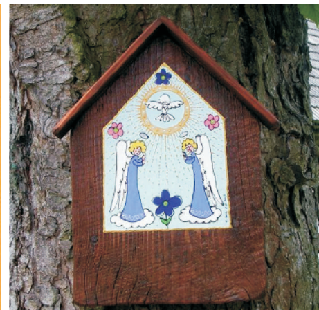
Prace autorstwa Zbigniewa Glika

dzieciństwa. Kategoria twórcza, w której spełnia się najpełniej to malarstwo akrylowe. Swoje charakterystyczne, barwne, nieco karykaturalne płótna zwykle nakleja na deski, tworząc specyficzną "ramę" będącą integralną częścią obrazu. Najbliższa jest mu tematyka wsi, parafraza pejzażu z ciekawymi wątkami sakralnymi-najczęściej aniołami-smutnymi, wesołymi zadumanymi zawsze nieco dziecinnyymi w rysunku. Zainteresowania męża wpłynęły na rozwój pasji twórczych jego żony, w wolnych chwilach zajmuje się ona koronką szydełkową oraz podobnie jak mąż malarstwem.