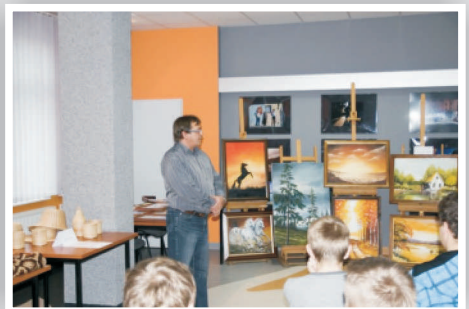
Wystawa Twórców Ludowych, Dom Kultury w Przysusze więcej na www.razemdlaradomki.pl