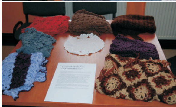
Prace twórców ze Stowarzyszenia „Wrzosowisko”