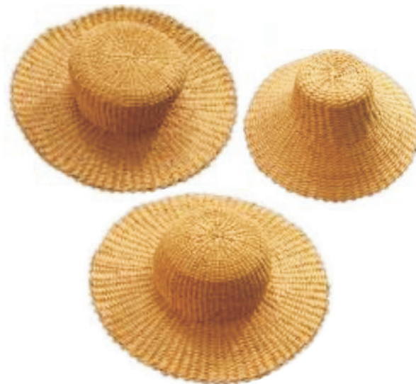
Kapelusze wyplatane przez panią Halinę Pękalę

Swoje prace sprzedaje za pośrednictwem CEPELII, na targach i jarmarkach sztuki ludowej, korzysta także z usług prywatnych pośredników. Uczestniczy w festynach