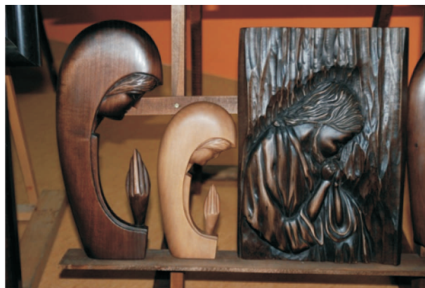
Rzeźby państwa Bałtowskich

..... kiermaszach „sztuki ludowej” (tak też je określają), podczas m.in. „Dni Kolbergowskich” oraz podobnych imprez w Radomiu, Szydłowcu, Kazimierzu Dolnym. Współpracują również z Lokalną Grupą Działania „Razem dla Radomki”