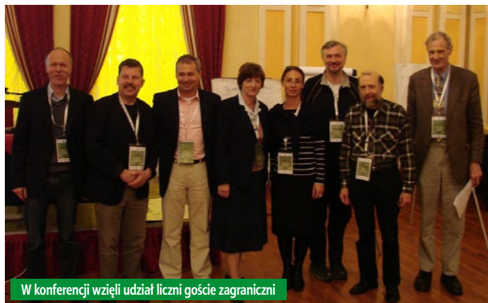
W konferencji wzięli udział liczni goście zagraniczni

Celem konferencji było włączenie obywateli Europy w realizację Europejskiej Strategii Zrównoważonego Rozwoju oraz wyjaśnienie powiązań między miastem a wsią w promowaniu zrównoważonego rozwoju w perspektywie Unii Europejskiej. Kontekstem projektu były wyzwania, przed którymi stoi świat, związane ze zmianami klimatu, zwiększeniem populacji, zmianami standardu życia oraz kry-