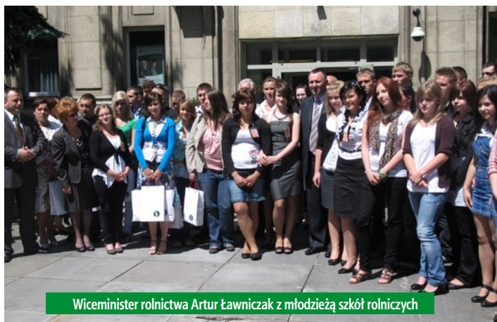
Wiceminister rolnictwa Artur Ławniczak z młodzieżą szkół rolniczych