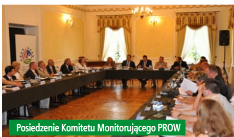
Posiedzenie Komitetu Monitorującego PROW