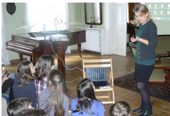
Realizacja projektu „Podróże Pani Bałtowskiej”

Pierwszym etapem projektu były niedawne warsztaty dla dzieci w siedzibie muzeum w Przysusze, które poprowadzili pracownicy Ośrodka Edukacji Muzeum Łazienki Królewskie w Warszawie. Uczniowie klasy V a wraz z opiekunem i pracownikami muzeum obejrzeli replikę przenośnej biblioteczki, przenieśli się w świat kultury XVIII wieku, "poczułi" łazienkowski ogród wieloma zmysłami. Zajęcia przeprowadzone były w ciekawy sposób, dzieci aktywnie w nich uczestniczyły. Drugim etapem jest wyjazd do Warszawy, gdzie dzieci wezmą udział w warsztatach w oryginalnej XVIII wiecznej scenarii Łazienek.