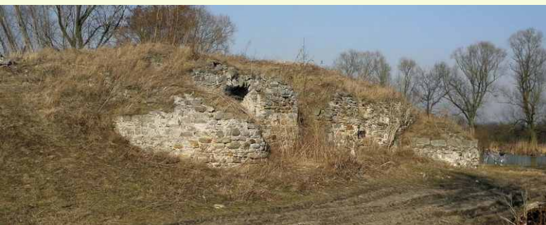
Ruiny dworku w Żurowie