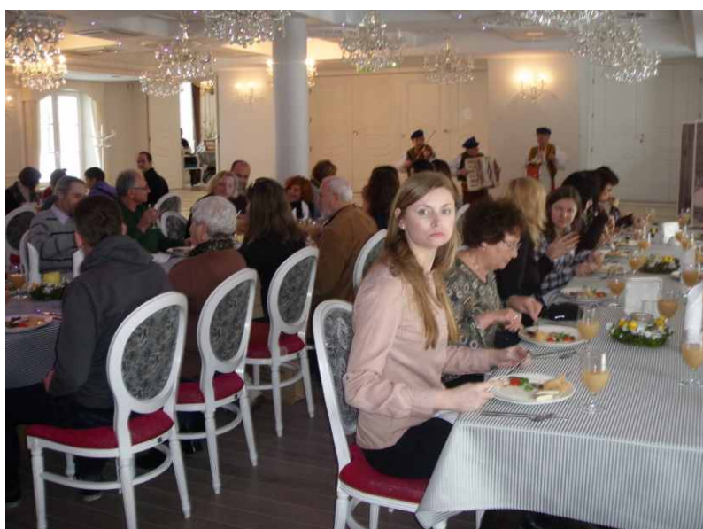
Międzynarodowa wizyta studyjna Agrotrip