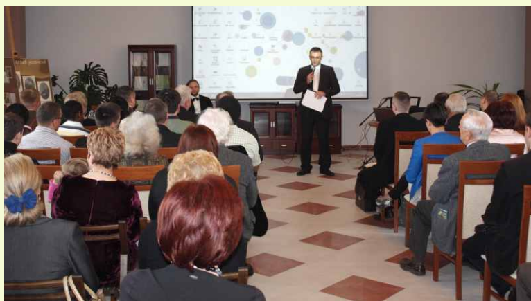
Konferencja „20lecie międzywojenne w kulturze polskiej”