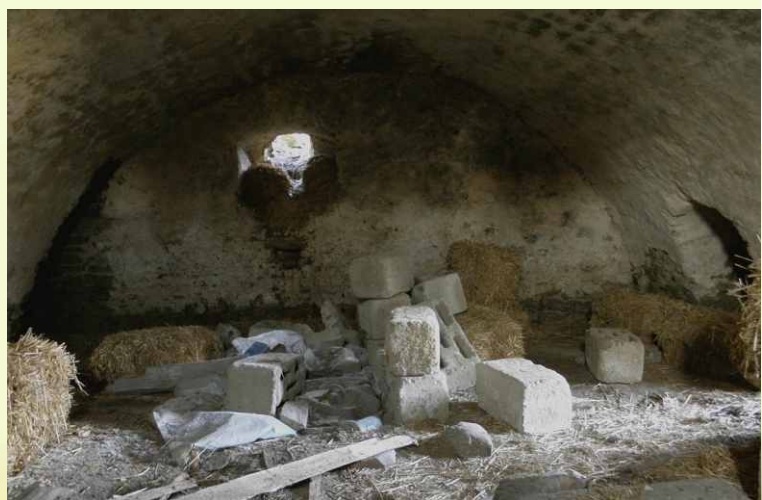
Ruiny dworku w Żurowie