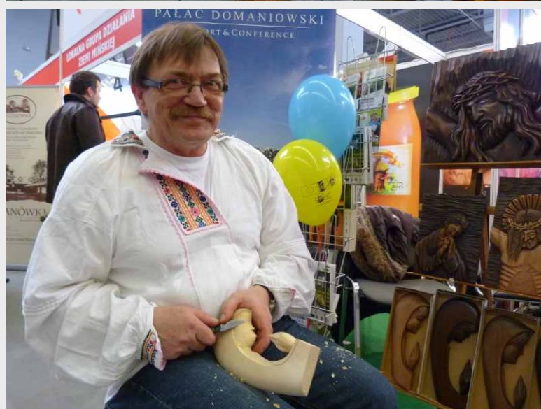
Stowarzyszenie LGD „Razem dla Radomki” na targach Agrotavel 2013

podejścia w rozwoju tego sektora gospodarki w oparciu obudowanie i sieciowanie produktów turystycznych oraz efektywne działania marketingowe.