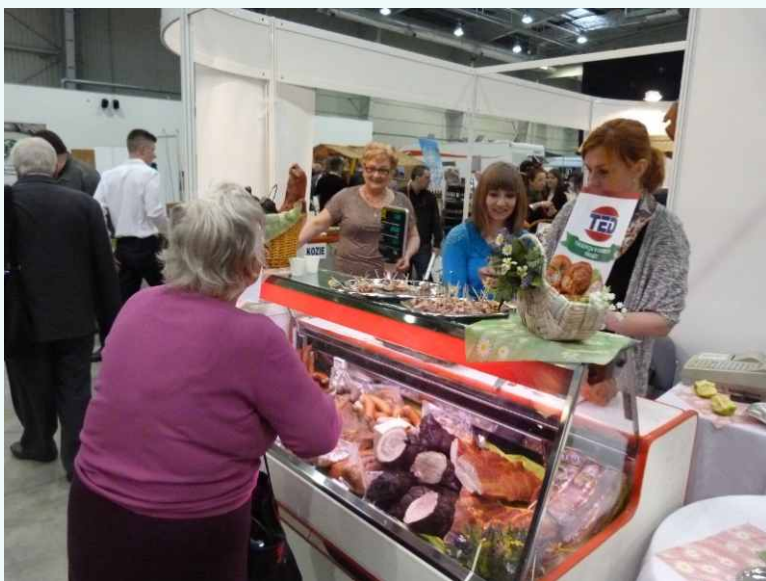
Regionalia 2013r.